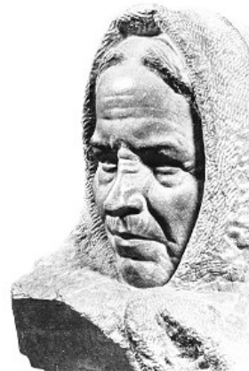
Maminka Solnohradský mramor 1917