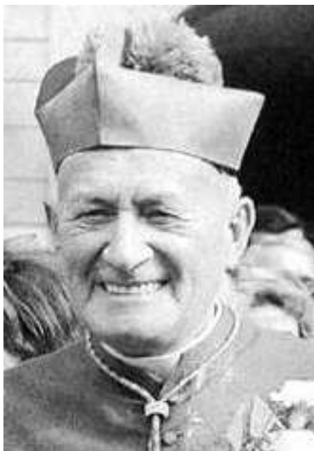
ThDr. František kardinál Tomášek

Životní osudy těchto dvou mužů si byly po roce 1948 hodně podobné. Oba si prožili za dobu komunistického režimu své roky na nucených pracích v internačním (koncentračním) táboře v Želivě, oba po návratu domů mohli pracovat v duchovní správě jen v malých „zapadlých“ vesnicích. Později - kolem roku 1962 se jejich životní příběhy mění. Dr. Tomášek odchází jako biskup a později kardinál do Prahy. Jeho výrazné působení ve funkci pražského arcibiskupa je alespoň starší generaci obecně známo a pro mladší generaci dnes už běžně dostupné v literatuře.