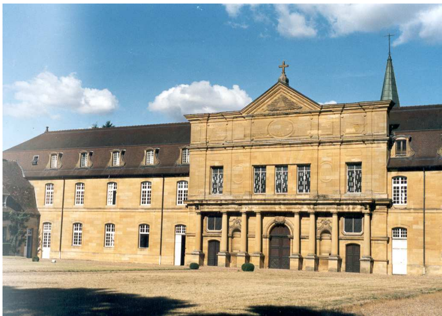
Kaple Matky Boží opatsví Sept Fons.